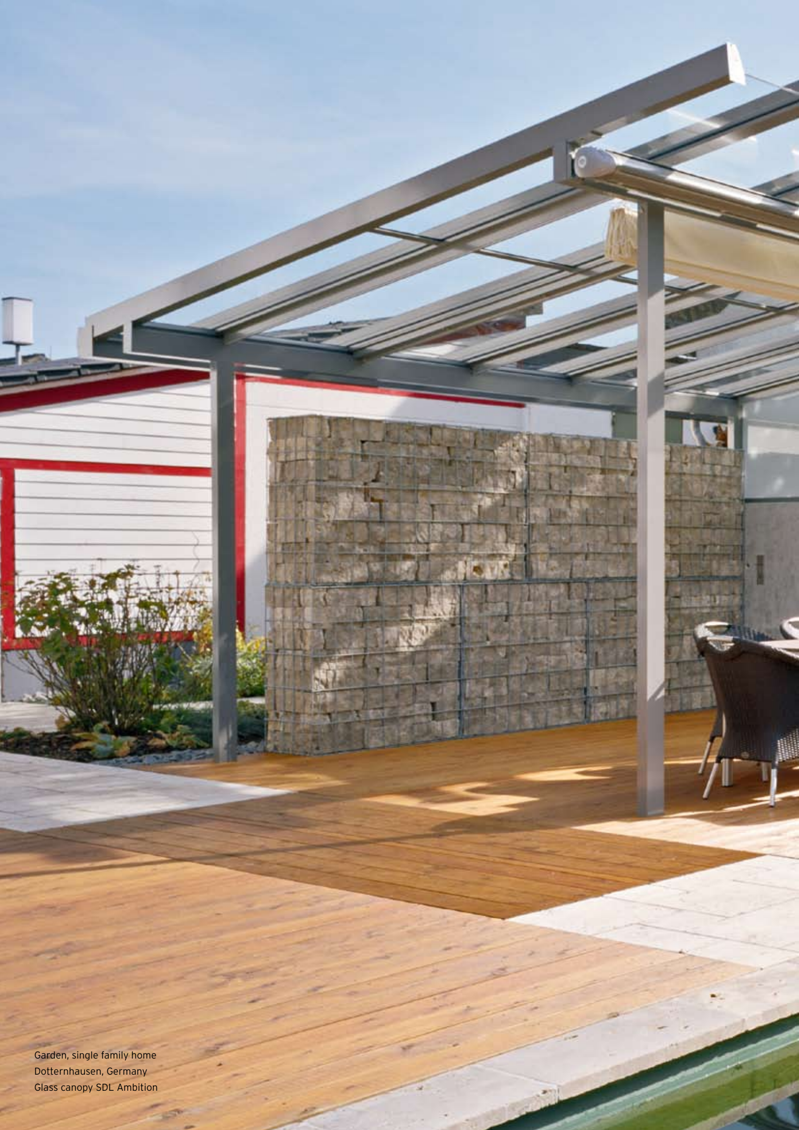
Garden, single family home Dotternhausen, Germany Glass canopy SDL Ambition