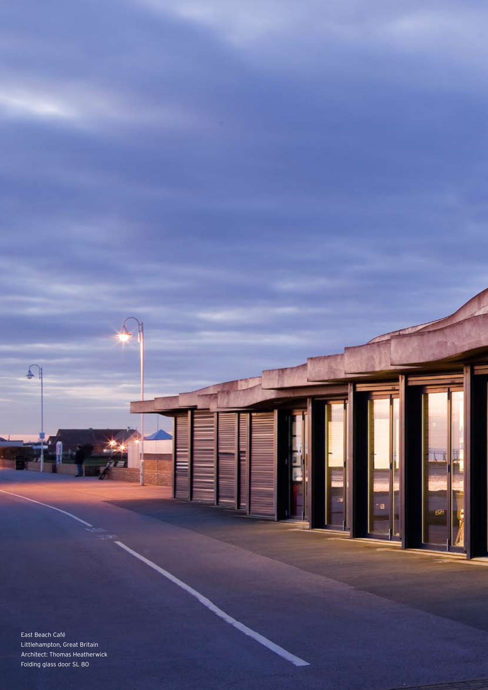
East Beach Café Littlehampton, Great Britain Architect: Thomas Heatherwick Folding glass door SL 80