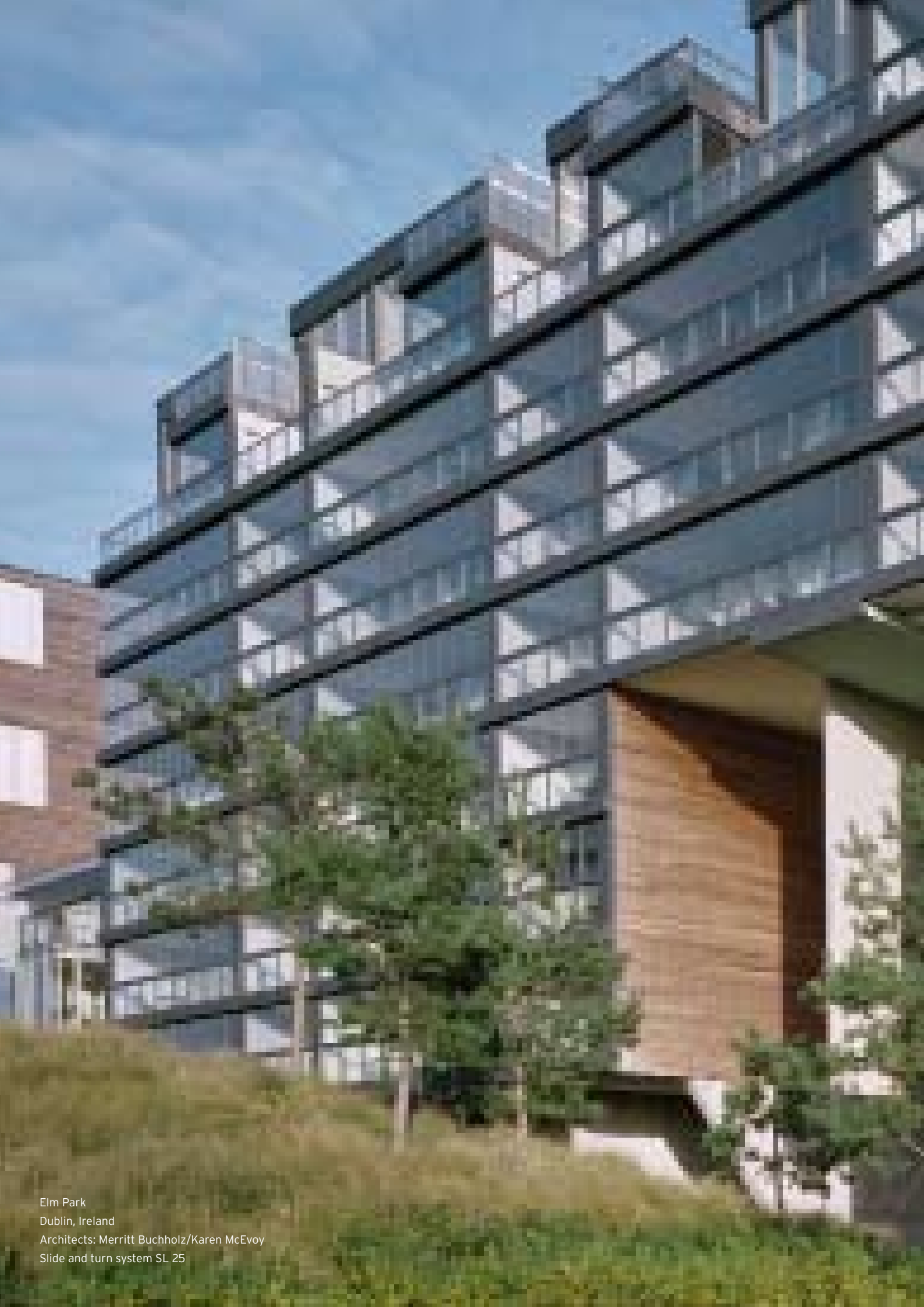
Elm Park Dublin, Ireland Architects: Merritt Buchholz/Karen McEvoy Slide and turn system SL 25