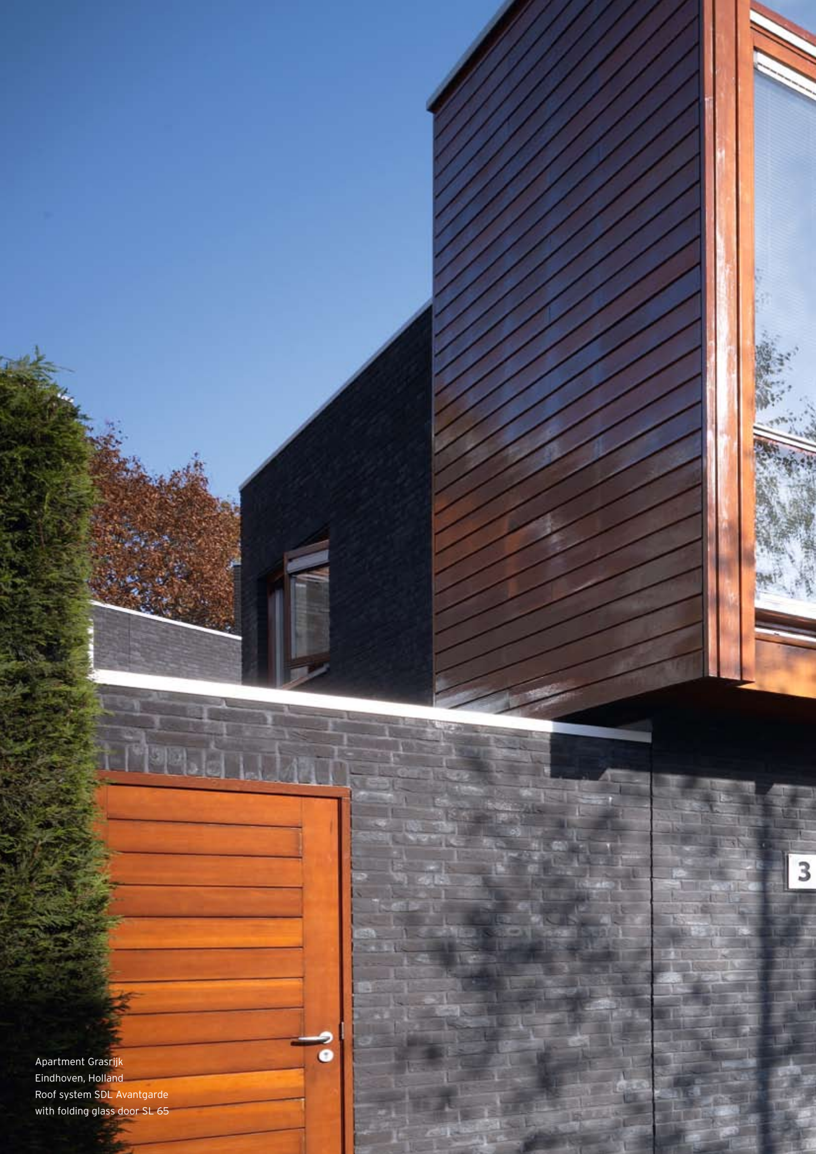
Apartment Grasrijk Eindhoven, Holland Roof system SDL Avantgarde with folding glass door SL 65