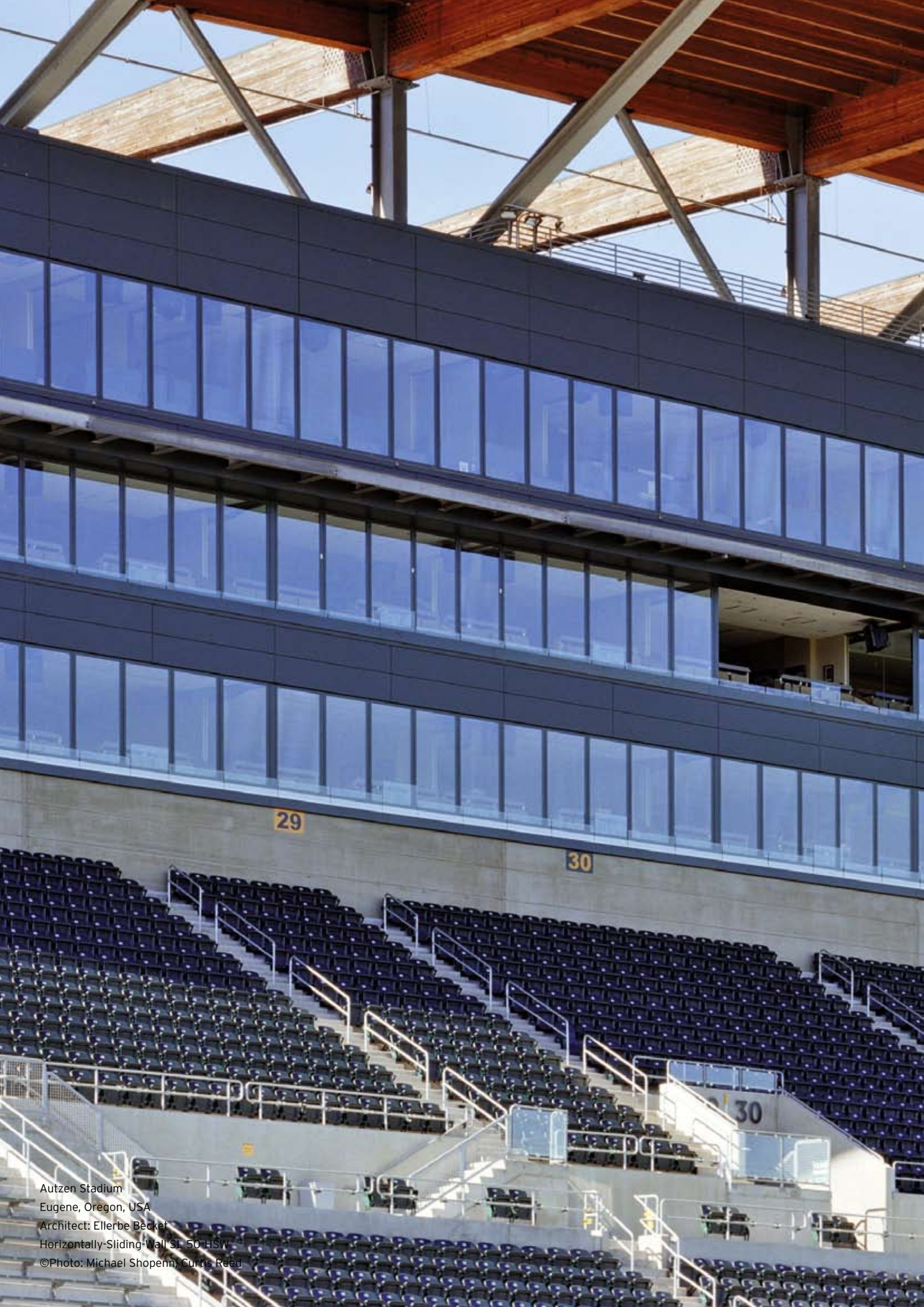
Autzen Stadium Eugene, Oregon, USA Architect: Ellerbe Becker Horizontally-Sliding-Wall SL 50 HSW