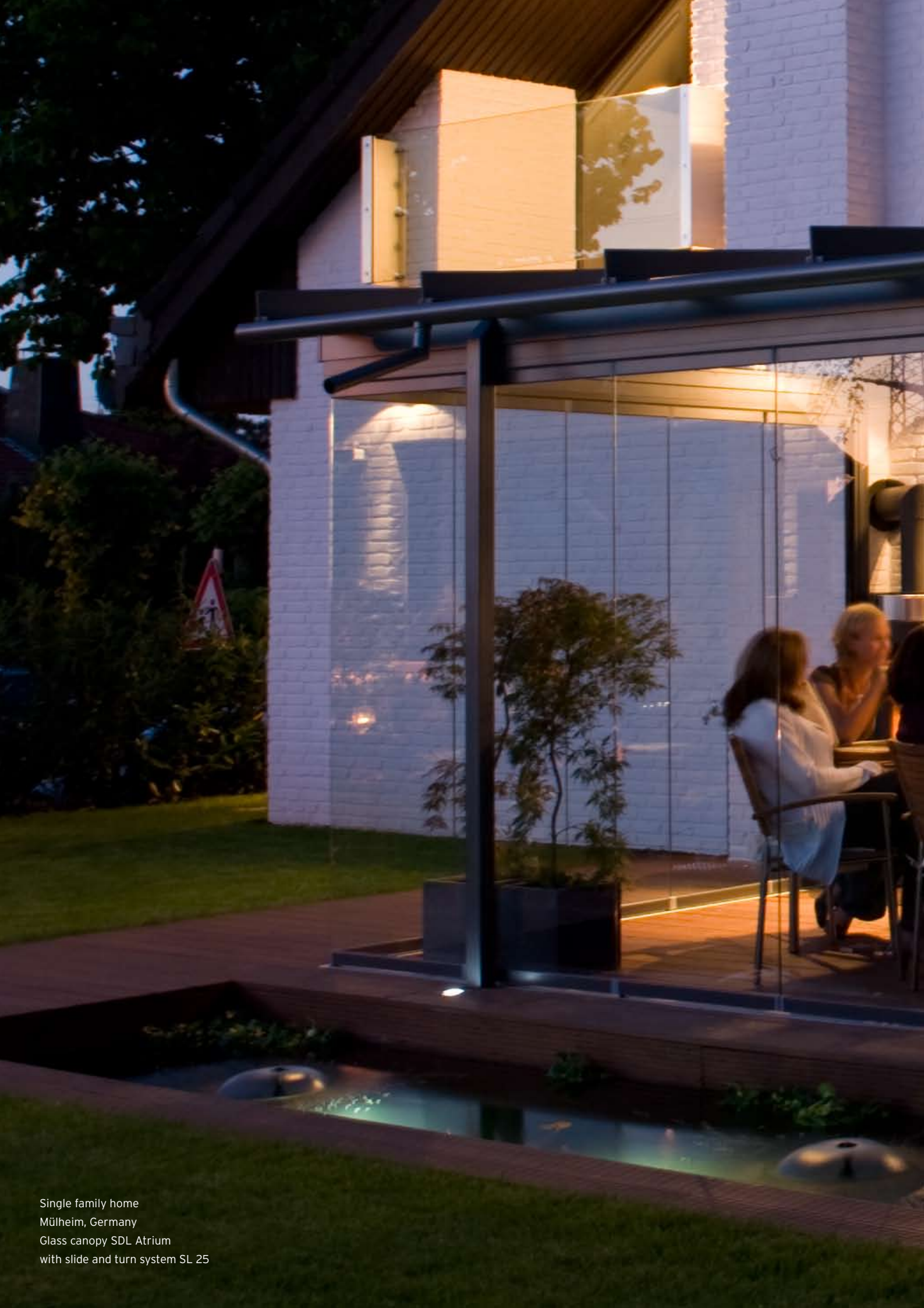
Single family home Mülheim, Germany Glass canopy SDL Atrium with slide and turn system SL 25